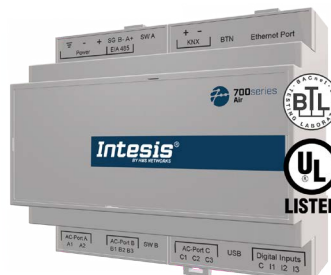
Split & VRF Gateways