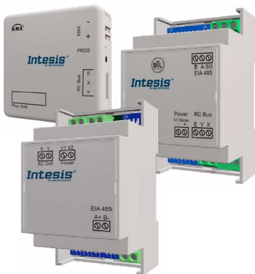
Single Split Gateways

Die Gateways ermöglichen eine vollständig bidirektionale Kommunikation zwischen Systemair Split- und VRF-Systemen und einem Gebäudemanagementsystem.